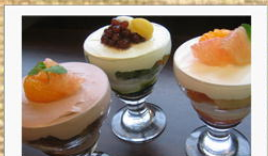
ケーキパフェ 各¥500 (フルーツ・抹茶・チョコ)