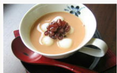
ミルクティーぜんざい ¥850