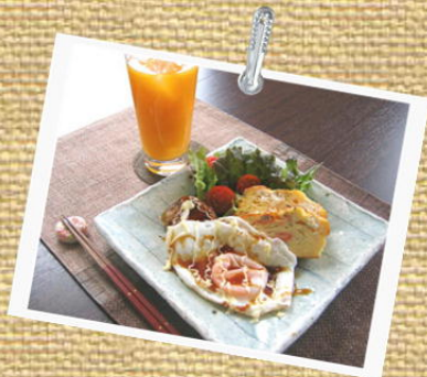
ケーキサレセットB ¥1200

オリーブとクリームチーズの塩ケーキ 季節のメインおかず1品 ミニ京風ロコモコ サラダ ドリンク又はスープ