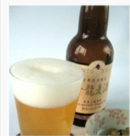
京都・清水限定ビール ¥700