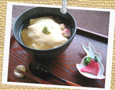
ゆば丼 (お漬物付) ¥950

ご飯の上に湯葉をたっぷりのせ、 上から京風だしのあんかけをかけました。 京都のお漬物と一緒にどうぞ。