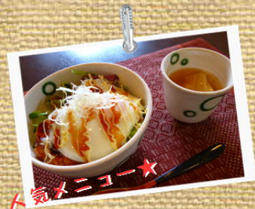
★ トキメキココ★ 京風ロコモコ丼 (スープ付) ¥950

オリーブとクリームチーズの塩ケーキ ミニ京風ロコモコ サラダ ドリンク又はスープ