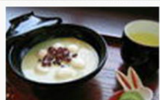
抹茶豆乳ぜんざい¥850